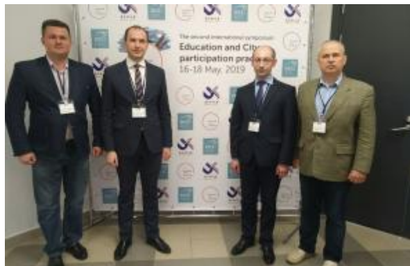
( http://gsu.by/sites/default/files/images/articles/2019-05/190523-18.jpg )